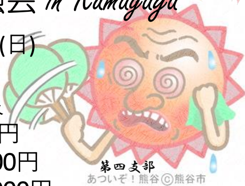
第四支部 あついで！熊谷